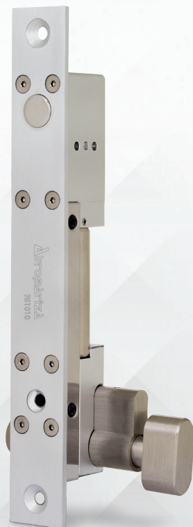
Fechadura solenoide Fail safe/Fail secure